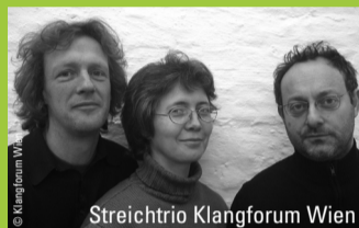
Streichtrio Klangforum Wien