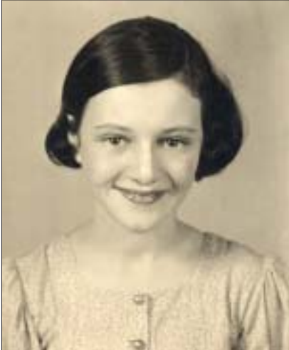
Ilse Brüll wurde im Alter von 17 Jahren ermordet

Ilse Brüll, geboren am 28.04.1925 in Innsbruck, Tirol Deportation: von Westerbork nach Auschwitz Deportationsdatum: unbekannt gestorben in Auschwitz am 03.09.1942